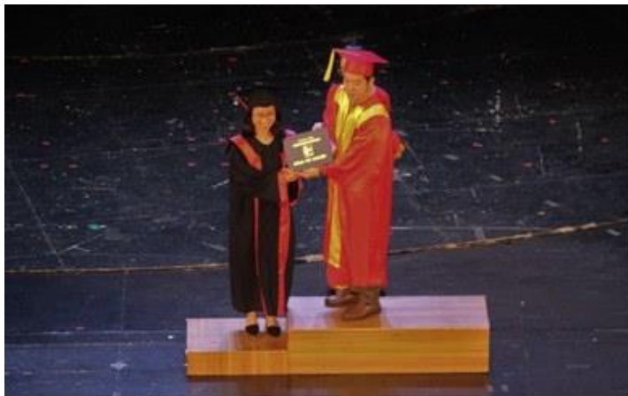
De twee afgestudeerde SPI-girls

Speciale aandacht is er voor Engelse lessen. In 2021 krijgen alle kinderen meerdere malen per week gedurende meerdere uren Engelse les. Alle Engelse lessen vinden plaats in de opvanghuizen zelf. Mede omdat er tussen de kinderen niveaueverschillen zijn, is het van belang dat de Engelse lessen professioneel worden gegeven. Voor de opvanghuizen worden professionele docenten ingehuurd. Deze Engelse lessen worden niet betaald uit de reguliere exploitatiekosten. Stichting K.I.D.S. betaalt deze kosten separaat, onder andere uit de opbrengsten van donaties en charity events.